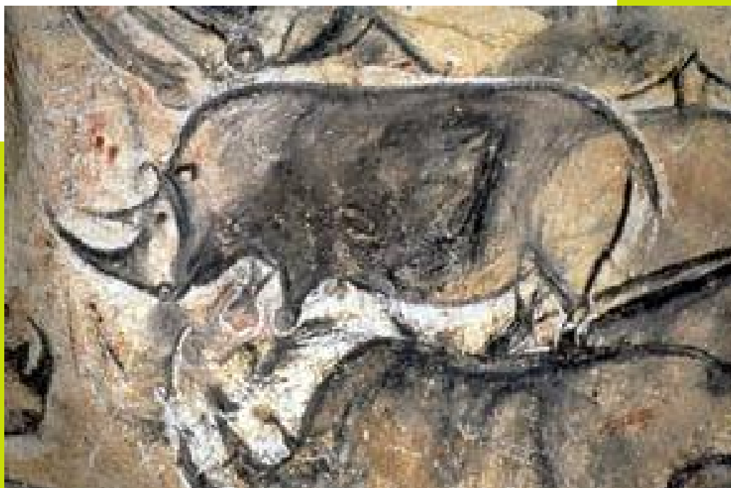
© Grotte de Chauvet-Pont-d'Arc. Auteur : Jean CLOTTES Les plus spectaculaires parmi les rhinocéros d'un groupe qui en comprend 17. Ces animaux sont particulièrement abondants dans la Grotte Chauvet-Pont-d'Arc.

Depuis la préhistoire, ces mondes souterrains sont les musées naturels de ces œuvres.